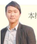
本报全媒体记者 付 强