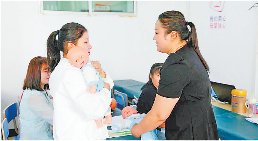
培训老师指导学员护理婴幼儿。

养老护理、电商运营、家政服务……5月23日,走进黎川县社草乡“5+2就业之家”,记者发现,该县就业创业服务中心推出的职业技能培训课程,线上线下同时发布。求职妇女只需关注“5+2就业之家”微信公众号和视频号,即可实时获取用工招聘信息与培训资讯。