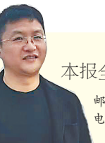
本报全媒体记者 洪怀峰