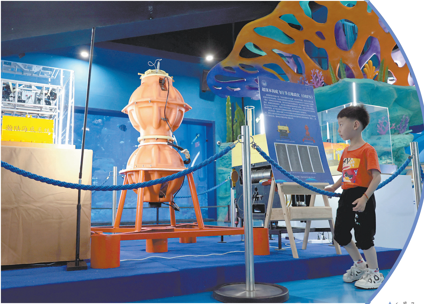
▲6月7日,一名小朋友在中国大洋协会成立35周年成就展现场了解起深水海底飞行节点地震仪。