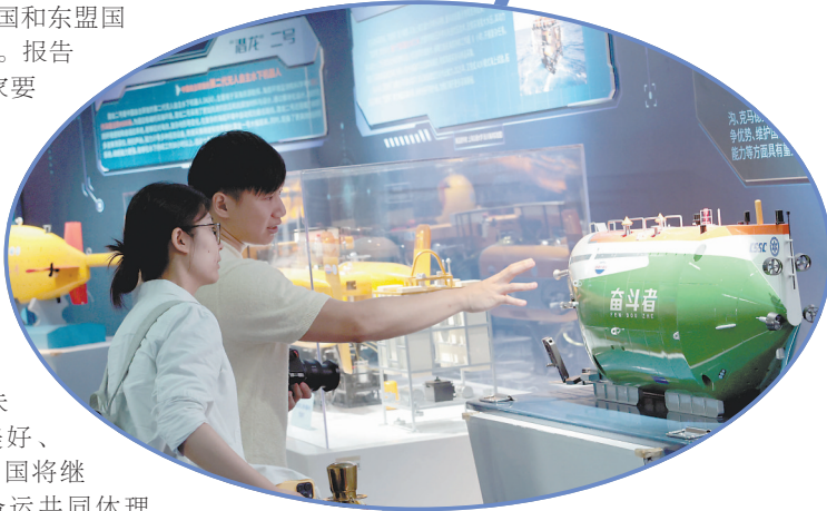
▲6月7日,中国大洋协会成立35周年成就展现场,参观者在“奋斗者”号模型前交流讨论。

南海是中国和东盟国家的共同家园。报告呼吁,地区国家要把握解决南海问题的钥匙掌握在自己手中,牢牢坚持妥协和把握要处南海问题的正确原则和方向,南海地区的未来必将更加美好、更加光明。中国将继续秉持海洋命运共同体理念,做海洋和平的维护者、海洋秩序的建设者、海洋合作的推动者、海洋发展的贡献者,让南海成为造福地区各国人民的和平之海、友谊之海、合作之海。