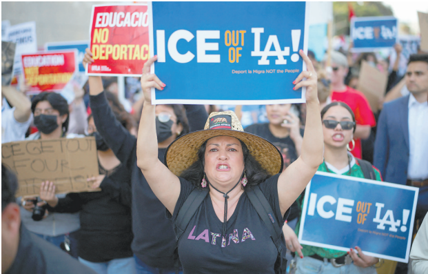
6月6日,在美国加利福尼亚州洛杉矶,抗议者手举标语参加集会。

南加州美国公民自由联盟的消息说,在联邦政府执法人员6日对多处公共场所的突击搜查行动中,包括儿童在内的上百人被捕。