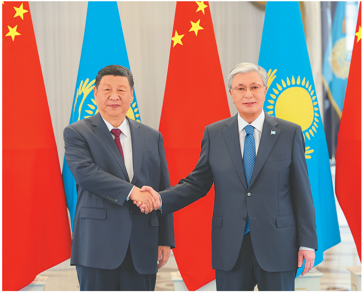
当地时间6月16日下午,哈萨克斯坦总统托卡耶夫同中国国家主席习近平在阿斯塔纳总统府举行会谈。