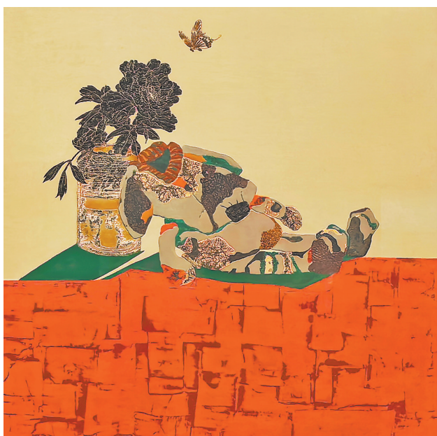
图4:《庄周梦蝶》李媛作