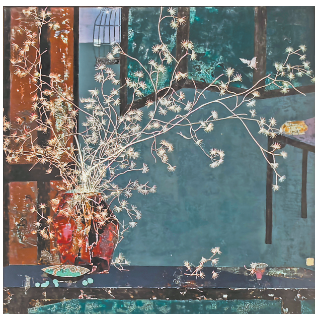
图5:《清》杨成果、许阳作