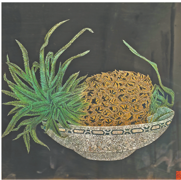
图3:《菠萝熟了》祝重华作

现代美术的发展,使各画种的界限逐渐被打破。漆画艺术也在不断吸收其他画种的精华,不断与时俱进,融入现代元素,展现出符合时代审美的艺术魅力。