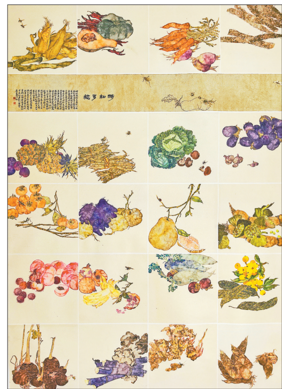
国画《时和岁稔》蒋芳圆绘

《时和岁稔》的创作,是我一次艺术的探索,更是一次心灵的洗礼,让我更加深刻地认识到,艺术源于生活,又高于生活。作为一名绘画作者,我有责任用手中的画笔,记录时代的美好,传递积极向上的正能量。