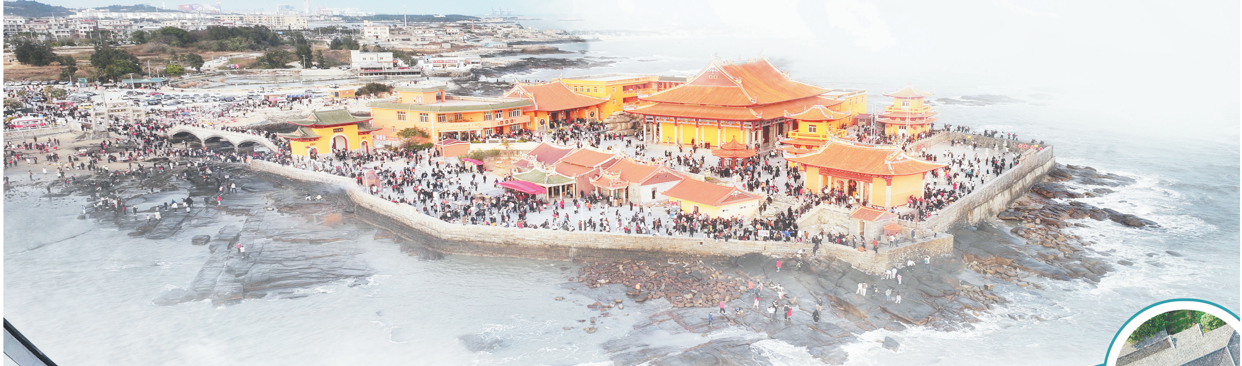
游客在福建省晋江市五店市传统街区游玩