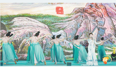
“如画江西 风景独好”文化和旅游（福州）推介会现场