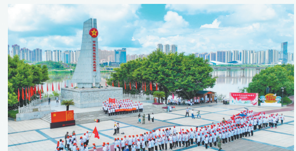
于都红色旅游持续升温

当景德镇陶瓷和德化白瓷见证海上丝绸之路的繁华，当赣闽“茶马古道”茶香四溢……赣闽文旅正携手共赴更加美好的诗与远方。