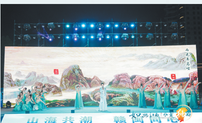
山海共潮 赣闽同游