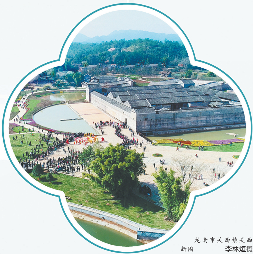
龙南市关西镇关西新园 李林垣摄