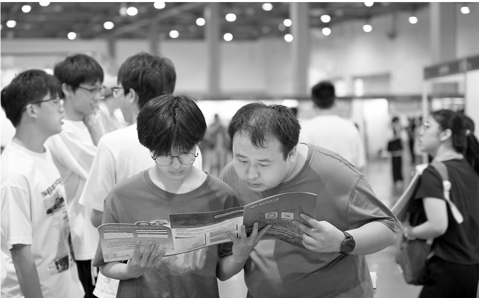
咨询会现场吸引了众多考生及家长前来咨询。

(上接第1版)印发《景德镇市市直机关事业单位编外聘用人员清理规范工作方案》，清理非编人员1159名，每年可为市本级财政减负4000余万元；对照文风会风不实不正、搞文山会海问题，深入开展简报专项摸排清理，对主题相近、内容空洞、缺乏实效的进行撤并，精简简报19.5%。 景德镇坚持开门教育，以开展“问需、问计、问效”行动为抓手，采取实地调研、走访座谈、网络征集等方式，广泛听取群众意见，着力解决群众急难愁盼问题。通过调研座谈，征集群众意见建议367条；通过政企圆桌会等方式，征集企业和经营主体意见建议240多条。民有所呼，我有所应；民有所盼，我有所为。景德镇珠山区聚焦群众关切，推动南山艺术陵园公墓降价，幅度达51%，预计全年可为群众减少丧葬费用352万元；浮梁县急企业之所急，大力开展“我为企业办实事”活动，各级干部赴实地为233家企业协调解决用地审批、用工短缺等难题277个。