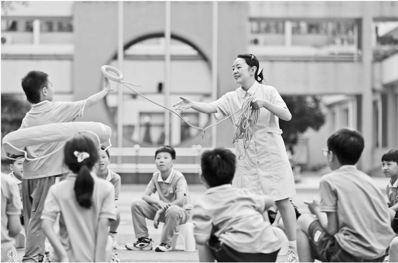
图①为6月27日，在四川省乐山市翡翠实验学校，护士为学生传授防溺水自救互救知识。