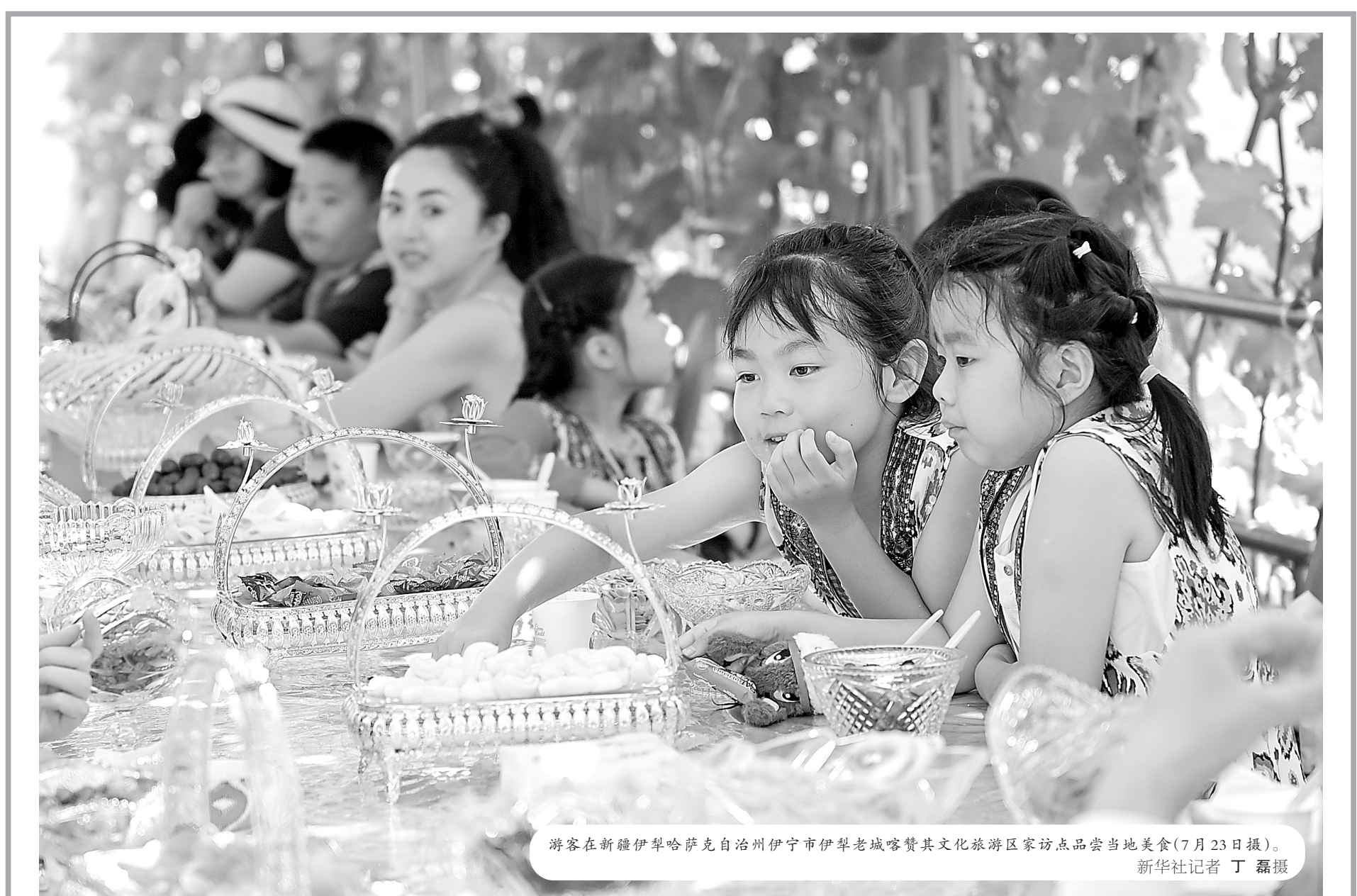
游客在新疆伊犁哈萨克自治州伊宁市伊犁老城喀赞其文化旅游区家访品尝当地美食(7月23日报)。新华社记者 丁磊摄

聚焦重大项目，今年上半年，青山湖区坚持招大引大，新引进数字经济项目共17个，协议投资总额26.645亿元，其中亿元以上项目8个，协议投资总额23.24亿元，包括里斯朗光学仪器5G智慧生产基地、江西(南昌)整体家居室内智造零部件超级供应链工厂、南昌九鼎智能针织产业基地、智能饮品生产线等项目，为青山湖区的高质量发展插上了“数智之翼”。