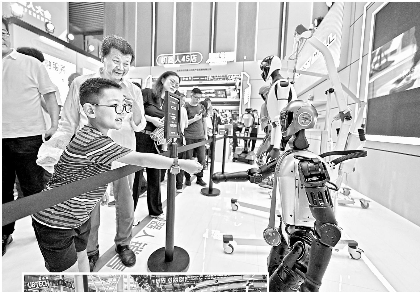
▲图为小朋友和机器人握手。