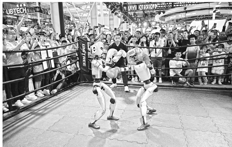
▲图为机器人进行格斗比赛。