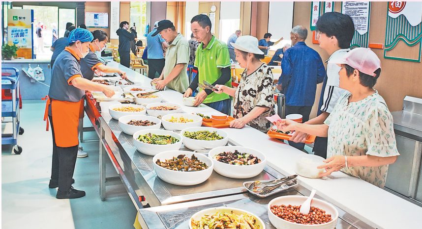
在浔阳区南司社区的“幸福食堂”里,老人们有序就餐。

幸福院里,更是一派热闹景象。1450平方米的空间里,老人们围坐打牌唱歌,留守儿童在大学生志愿者的辅导下写作业。“项目总投资150万元,其中福彩公益金占130万元,日均助餐1500人次,助娱2000人次。”村支书柳保华算了笔民生账。截至今年6月,九江市已运营93个“一老一小幸福院”,福彩公益金的注入让“朝夕美好”照进现实。