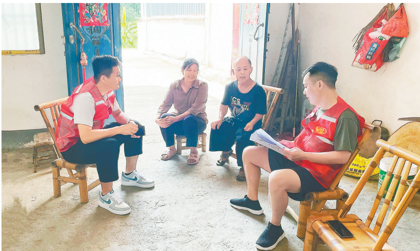
安远县长沙乡民政干部上门摸排困难群众。

安远县按照有空间、有队伍、有服务、有机制的标准,打造县、乡、村三级社会救助综合服务平台。该县在179个村(居)设立社会救助服务点,推行“一证一书”极简申请模式,通过一次性告知、材料精简、当天受理,实现“减材料不减责任”的一站式服务。乡镇便民服务大厅专设“一门受理、协同办理”窗口,推行“一次申请授权、一次调查核对、一次审核确认”闭环流程,