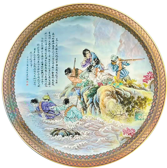
粉彩瓷画《八女投江》夏良绘

彈痕如淚奮成鐵幹虬枝主碧霄 星雲飛血注千重烽火化霞飄長榮浩氣 根猶壯漫寫蒼蒼意已鴻之風煙何所 策輪不語捲雲潮 行书《抗战胜利八十周年观古槐有吟》释文：弹痕如泪奋成铁。虬枝主碧霄。八十星霜悲血注。千重烽火。化霞飘。长荣浩气根犹壮。漫写苍苍意已鸿。欲问风烟何所以。年轮不语卷春潮。吴伟柱撰，李良东书。