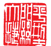
篆刻《平型关大捷》吴利国刻