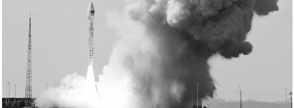
一箭七星！力箭一号遥十运载火箭发射成功

8月19日15时33分，力箭一号遥十运载火箭在东风商业航天创新试验区发射升空，将搭载的中科卫星05星，多功能试验二号卫星01星、02星、03星(天拓六号卫星)，天雁26星、ThumbSat-1卫星、ThumbSat-2卫星等7颗卫星顺利送入预定轨道，飞行试验任务获得圆满成功。