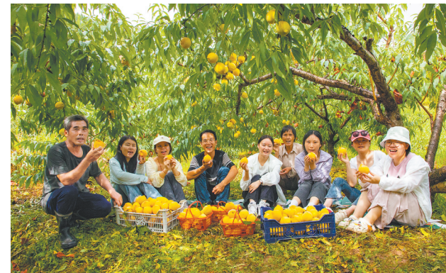
游客在大兴农场开心采摘黄桃。