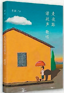
《走夜路请放声歌唱》 李娟 著 新星出版社