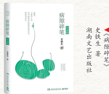
《病隙碎笔》 史铁生 著 湖南文艺出版社

当命运的巨石轰然砸落，截断了我们前行的水路时，愿我们都能记住本书静水深流的力量。不论生活多么困顿，但请相信，沉静水面之下奔涌不息的，正是足以穿石的万钧之力。