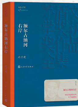
《额尔古纳河右岸》 迟子建 著 人民文学出版社

本书最动人的部分，或许就在于它对自然的礼赞。迟子建笔下的大兴安岭是一个充满灵性的世界。鄂温克人狩猎前会向山神祈祷，用熊骨听风吟，披鹿皮看星河，将生死融入自然循环。这些仪式让他们的生活充满了诗意。而迟子建的描写更是将这种诗意推向极致：“我这一生能健康地活到九十岁，证明我没有选错医生，我的医生就是清风流水，日月星辰。”