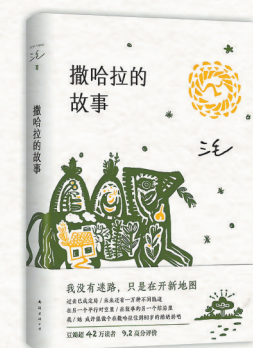
《撒哈拉的故事》 三毛 著 南海出版公司

以器物为锚，以技艺为舟，以声音为楫，全书431页、36.7万字凝聚为中华五千年的沧海一粟。那首名为“中华”的古老歌谣，在当代土壤里静默生长，震耳欲聋。