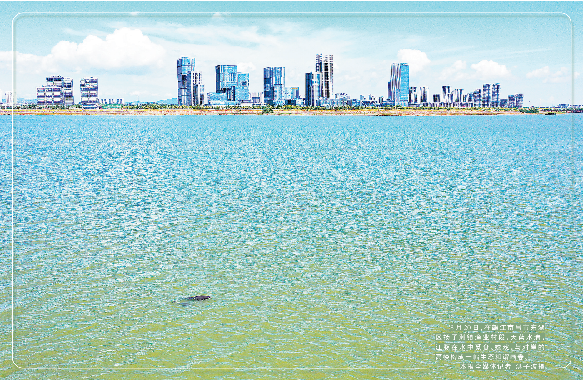
8月20日,在赣江南昌市东湖区扬子洲镇渔业村段,天蓝水清,江豚在水中觅食、嬉戏,与对岸的高楼构成一幅生态和谐画卷。