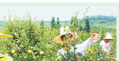
村民在采摘油茶果。