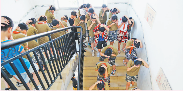
9月3日,石城县城市社区管委会温坊社区联合县消防救援大队温坊消防站,在县第五小学开展疏散演练、灭火器使用等活动,提升师生应对火灾的能力和安全意识。