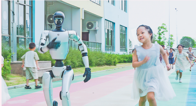
9月5日,余干县第七幼儿园,小朋友正在和人形机器人互动。连日来,余干县开展“科普大篷车”科技进校园活动,激发学生科学的兴趣。