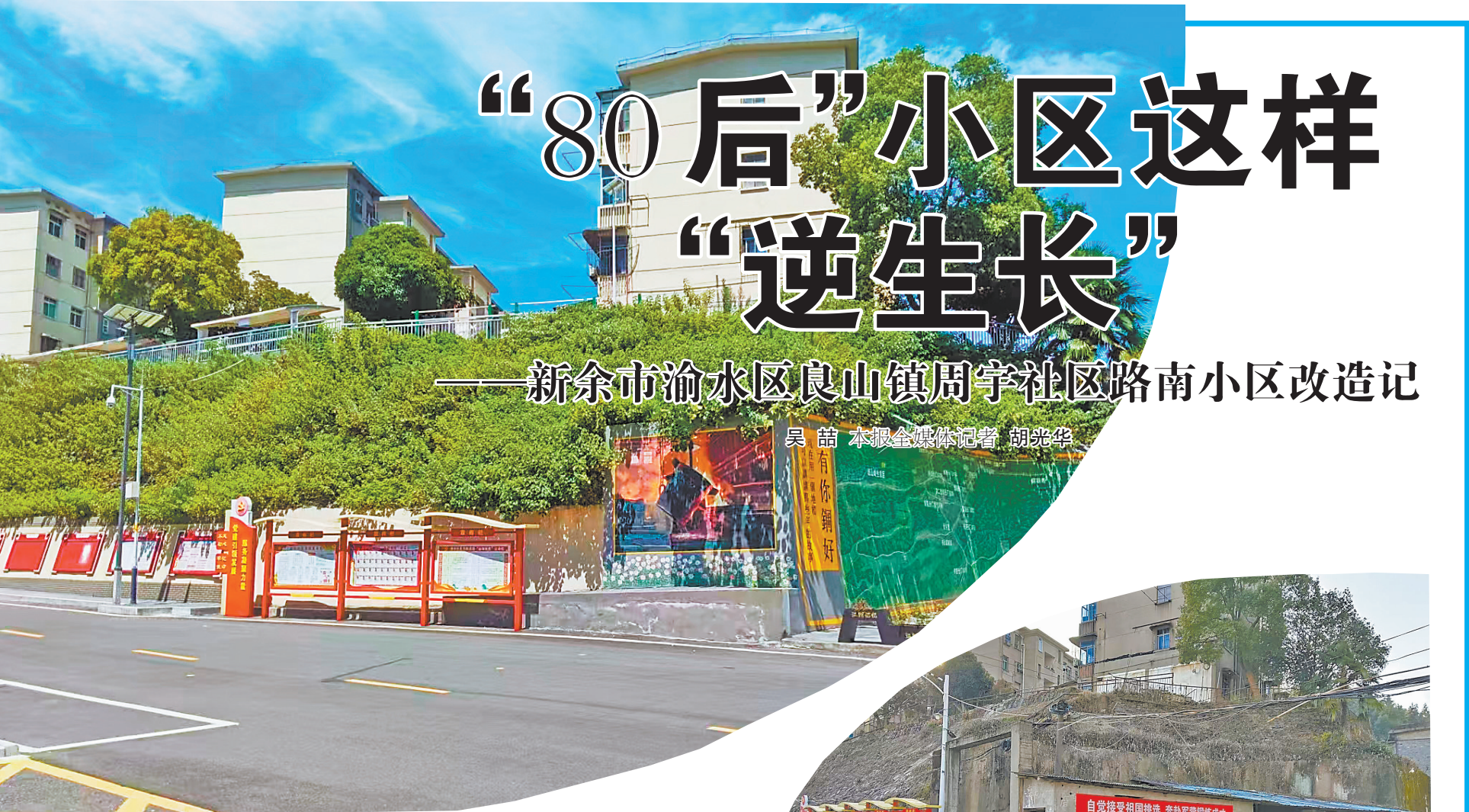
路南小区改造前和改造后的对比。