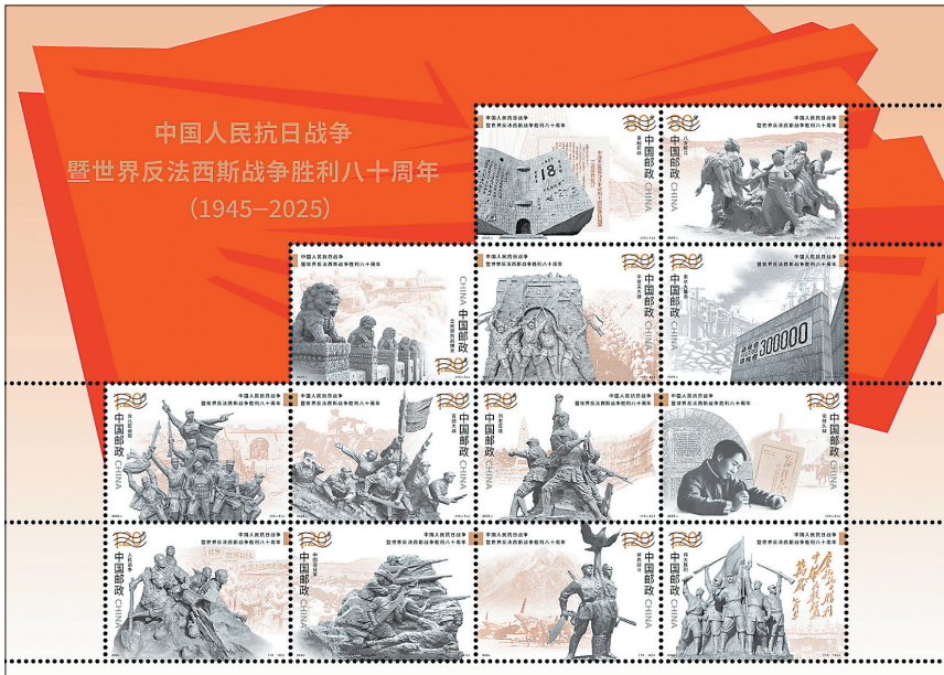
《中国人民抗日战争暨世界反法西斯战争胜利八十周年》纪念邮票

9月3日，中国邮政发行《中国人民抗日战争暨世界反法西斯战争胜利八十周年》纪念邮票一套13枚，小型张1枚。