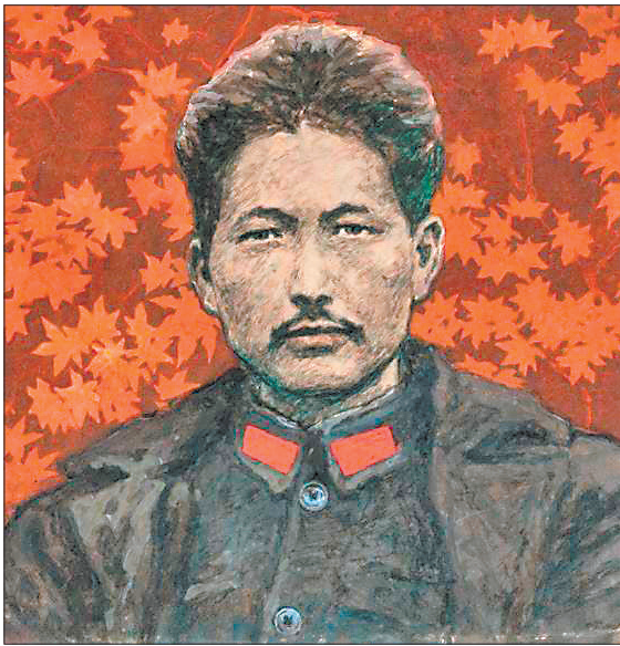
连环画《可爱的中国》选（一）赵奇绘