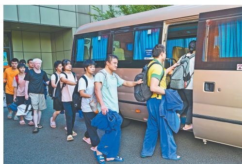
8月29日,盲人柔道运动员们相互帮衬着乘车。