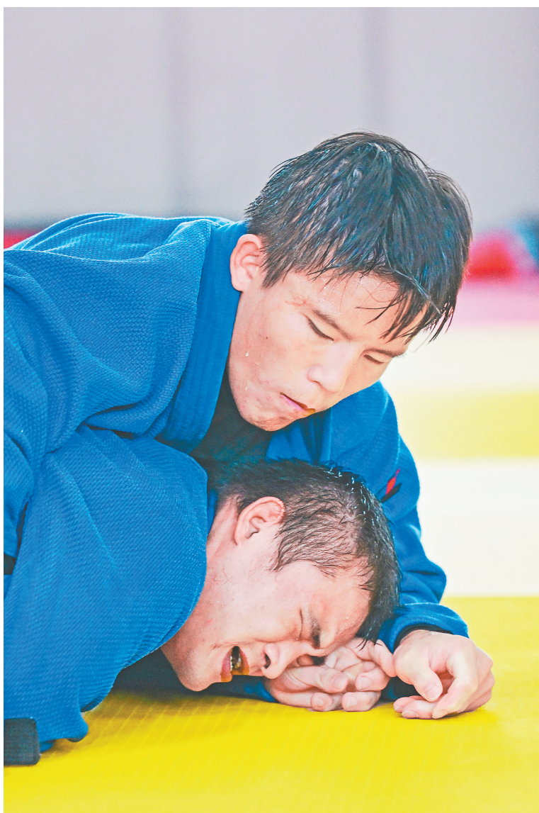
8月29日,柔道运动员扭打在一起,满脸汗水。