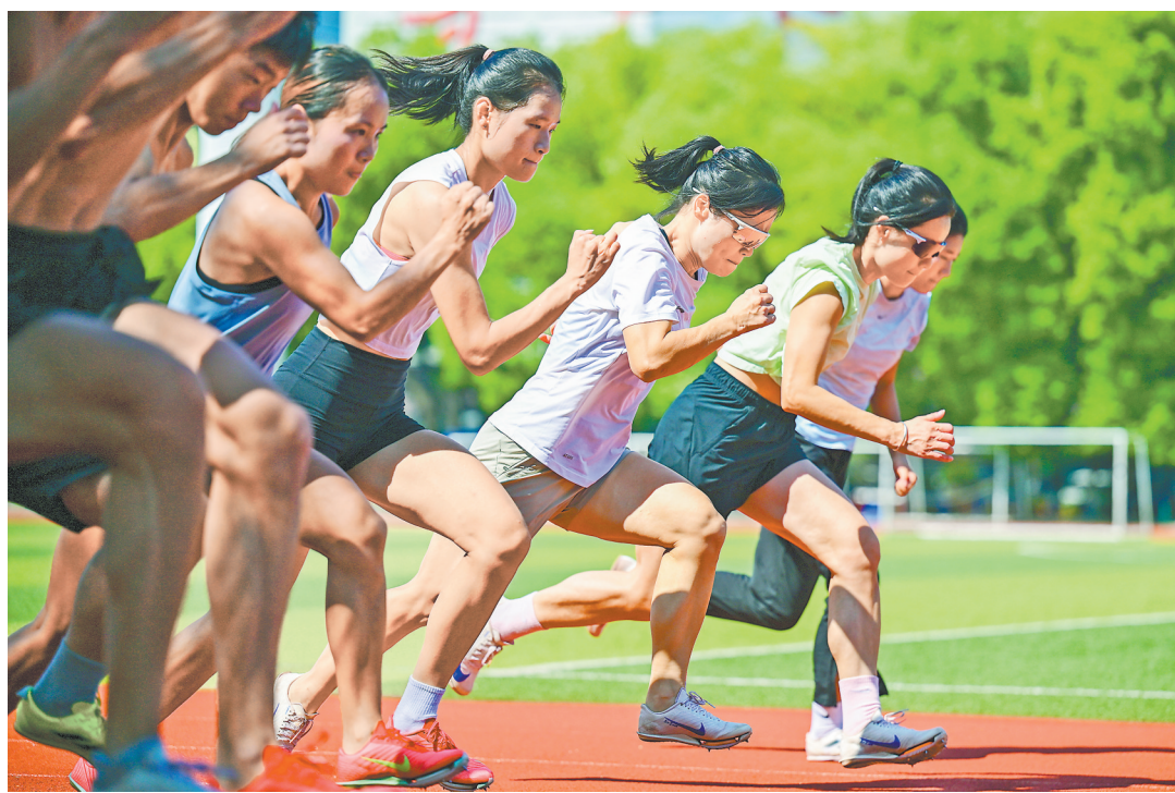
8月30日,短跑运动员们顶着烈日冲刺。