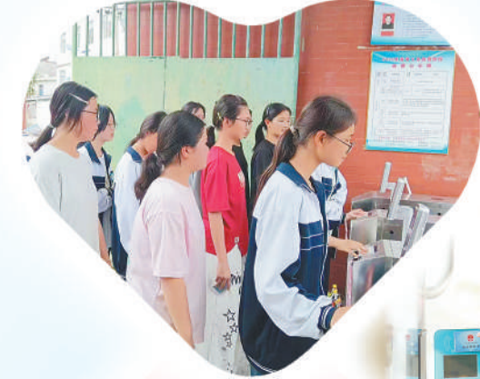
上栗县长平中学学生使用社保卡通过校园门禁

民生连民心,枝叶总关情。下一步,江西省将以群众需求为导向,以小卡片服务大民生,打通社保卡待遇发放和移动支付应用,完善“一卡通”服务生态圈,持续深化社保卡居民服务“一卡通”应用,让社保卡真正成为“记录一生、保障一生、服务一生”的贴心助手,实现“一卡在手、赣事无忧”的美好愿景。