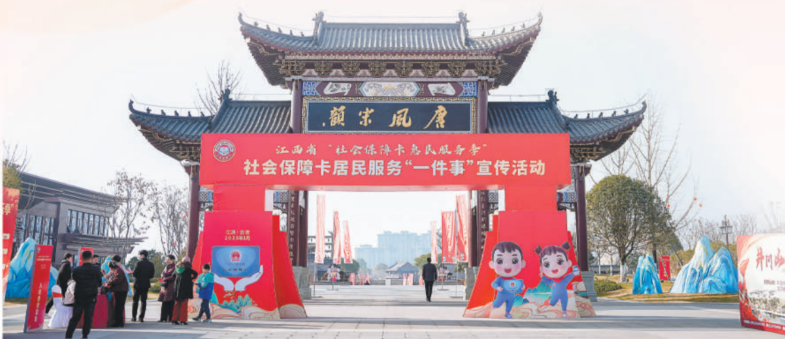
在吉安市举办江西省“社会保障卡惠民服务季”主场启动仪式