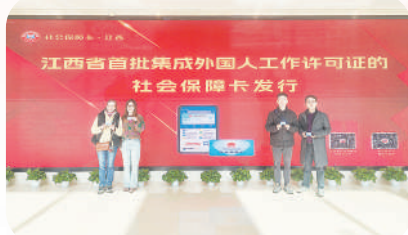
江西省首批集成外国人工作许可证的社会保障卡在南昌正式发行

今年1月15日,江西省首批集成外国人工作许可证的社保卡在南昌正式发行。当日,南昌大学的外籍专家和教师来到中国工商银行南昌红谷滩支行,在制卡窗口顺利领取到这一批新社保卡,成为此项便民举措的首批受益者。过去,外国人在华办理工作许可证与社保卡时,常面临申办手续繁琐、身份认证复杂、提交材料繁多、办理周期较长等问题。不少外籍人士因流程不便放弃办理社保卡,这在一定程度上影响了他们在华工作生活的便利性,给日常就医、生活缴费等带来诸多不便。此次推出的新社保卡,将持卡人个人信息、社会保障号码、工作许可号码、银行卡号等十几个关键要素优化集成,实现了“一卡集成信息、一卡承载多元服务”。新社保卡不仅整合了原本分散在不同证件中的信息,减少了外国人携带多张卡片的麻烦,大幅提升了信息集成度和服务多元性,还融入了金融支付功能,支持公交、地铁等