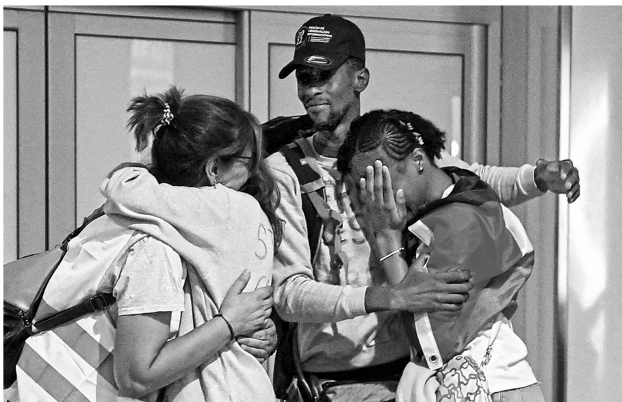
10月6日，遭以方扣押的赴加沙船队的西班牙人员抵达西班牙马德里巴拉哈斯机场。