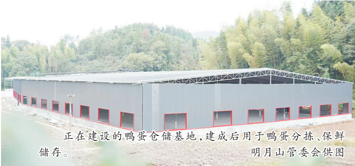
正在建设的鸭蛋仓储基地,建成后用于鸭蛋分拣、保鲜储存。

针对重点区域,明月山管委会实施“管网延伸+集中处理”,新建维景酒店沿河污水主管网,将维景月亮湾小区及天沐、维景酒店污水统一接入市政管网;推