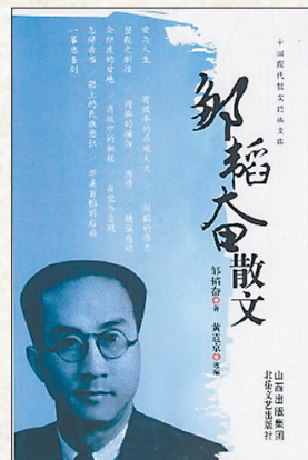
▲《邹韬奋散文》 邹韬奋著 黄道京编 北岳文艺出版社

温润又执拗的形象就愈发清晰起来,他并不是高高在上的圣人,而是会想母亲的孩子,他也不是超脱世俗的思想家,而是懂得人情冷暖、市井悲欢的普通人。正因为他又真实又真诚,所以即便相隔近一个世纪的文字依然能够打动我们的心。