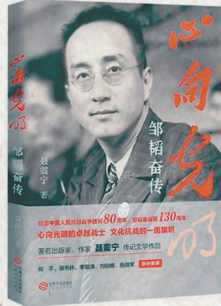
▲《心向光明:邹韬奋传》 聂震宁 著 江西人民出版社

体技术迭代升级,媒体生态、新闻舆论、传播格局更加纷繁复杂。新征程,新闻工作者要履行职责使命,做党的政策主张的传播者、时代风云的记录者、社会进步的推动者、公平正义的守望者,非常需要正本清源、守正创新,从历史中找源流、从文化中取滋养、从先贤中振精神。