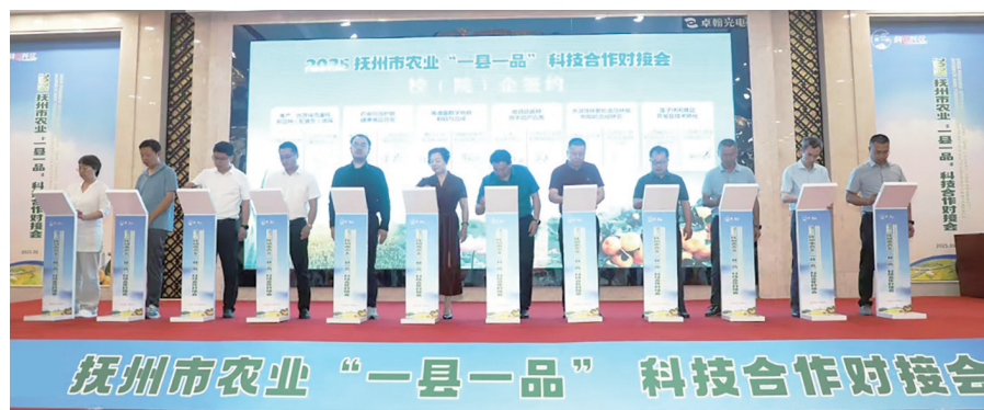
抚州市农业“一县一品”科技合作对接会现场

在品牌定位上，“赣抚农产品”以“生态抚州 绿色农产品”为品牌口号。这一定位既契合抚州的生态优势，又顺应了消费者对绿色、健康产品的迫切需求。为提升农产品市场竞争力，抚州市建立“母子品牌”运作模式，整合县域、企业农产品品牌，形成“赣抚农产品区域公用品牌+县域品牌+企业品牌”的矩阵架构，既保持整体形象统一，又保留地方特色，实现品牌价值的最大化。