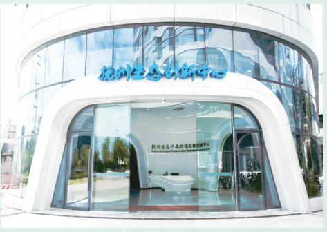
抚州生态创新中心

农业品牌，是乡村振兴的鲜活注脚，也是农业现代化的重要标志。从“赣抚农产品”农产品区域公用品牌建设的实践可见，一条以品牌引领农业高质量发展的路径愈发清晰。“赣抚农产品”农产品区域公用品牌建设不仅让优质农产品实现了价值跃升，更通过全产业链的优化升级，带动了产业发展方式的深刻变革，有力促进农业提质增效、农民增收。展望未来，抚州将继续深化品牌建设，推动“赣抚农产品”向“赣抚优品”蝶变升级，让“生态抚州 绿色农产品”的金字招牌熠熠生辉，为乡村全面振兴注入更强劲动能。