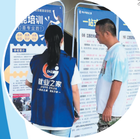
2025年9月萍乡北站“暖心归巢”送岗活动现场

截至目前，全市已通过“5+2就业之家”向返乡技能人才推送岗位4.72万个，培训7600人次，精准帮扶2.1万人达成就业意向，用实打实的成效书写民生答卷。