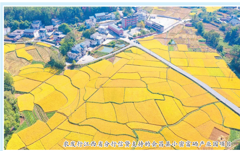
农发行江西省分行信贷支持的会昌县小密富硒产业园项目