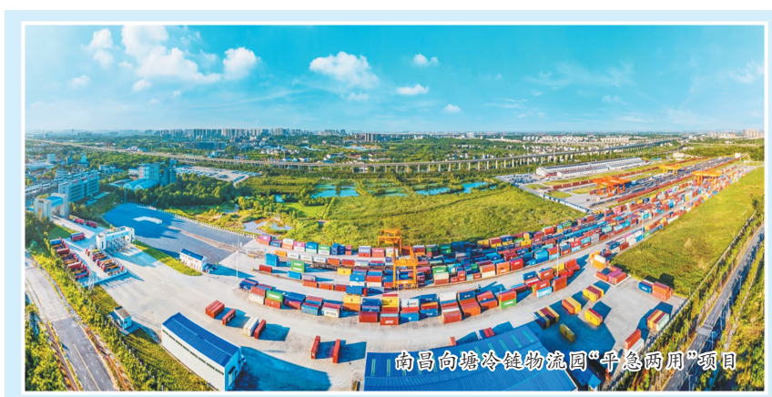
南昌向塘冷链物流园“平急两用”项目

基础设施是经济社会发展的重要支撑。作为全省服务基础设施建设的主体银行，国开行江西分行深入贯彻党中央、国务院决策部署，认真落实省委打造“三大高地”、实施“五大战略”，以重大项目为牵引，完善基础设施全生命周期服务和产品体系，不断加大全省现代化基础设施体系的投融资支持力度。助力扩大有效投资，“十四五”以来，分行累计发放基础设施贷款超2238亿元，投放基础设施投资基金134亿元，分行基础设施贷款余额占比较“十三五”末期提高11.3个百分点，有力支持固本培元、增强发展后劲。今年以来，投放44亿元新型政策性金融工具，支持项目52个，预计可带动项目总投资467亿元，助力巩固拓展经济回升向好势头。支持重大项目建设，制定金融支持江西省基础设施建设重大项目融资规划，积极发挥江西省重大项目第一金融服