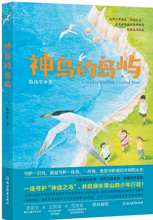
▲《神话的岛屿》 陈伟军 著 浙江教育出版社

得:有些记忆或许会被时光抹去,但对自然的热爱、对故土的眷恋,却早已刻进了骨子里。就像他当年在海岛小学讲的课:“今天一种鸟类放弃这块土地,明天我们可能失去更多。”这份对生命的敬畏,如今被女儿朱与蓝、外孙女林芊芊接续,也被江大鹏、叶伯伯们传承,成了铁墩岛上最