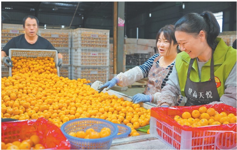
工人正在分拣刚采摘的蜜橘。