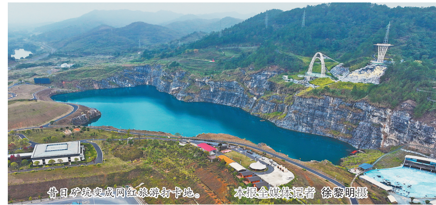
昔日矿坑变成网红旅游打卡地。

周末的安福县福海公园游人如织。谁能想到,眼前这个绿意盎然、湖水清澈的生态公园,曾是一处满目疮痍的废弃矿坑。从“城市伤疤”到网红打卡地,福海公园的华丽转身,是安福县以“绿色矿山+文化地标”创新模式推进生态修复,科学布局国土空间的生动缩影。 福海公园所在的起凤山,曾是一座长期开采石灰岩的废弃矿山。经年累月的挖掘,留下长480米、宽200米的巨大矿坑。2018年,安福县启动生态修复工程,先实施削坡减载,清运废弃表土层渣,再铺垫近10万立方米黄土,为植被生长筑牢基础,最后采用喷坡植草工艺,将混合植物种子的泥浆均匀喷洒在岩石表面,形成20厘米厚的“生态毯”。200多亩矿山变得绿意盎然,矿坑里的湖水泛着清透的蓝绿色,宛如镶嵌在城市近郊的绿宝石,吸引了凤凰县空管