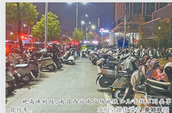
晚高峰时段,南昌西站南广场地铁口几乎找不到共享自行车。

“以前出了地铁口,共享电动自行车随处可见,扫个码就能轻松回家。现在红谷滩区全换成了共享自行车,但九龙湖这边的早晚高峰时段很难找到车。”近日,记者接到多名南昌市民反映,自11月15日南昌市将红谷滩区列为共享电动自行车禁投区域,只允许投放共享自行车以来,在九龙湖片区等相对较偏远区域难见共享自行车,从地铁站到目的地的“最后一公里”变得颇费周章,希望相关部门能关注、解决这一出行难题。