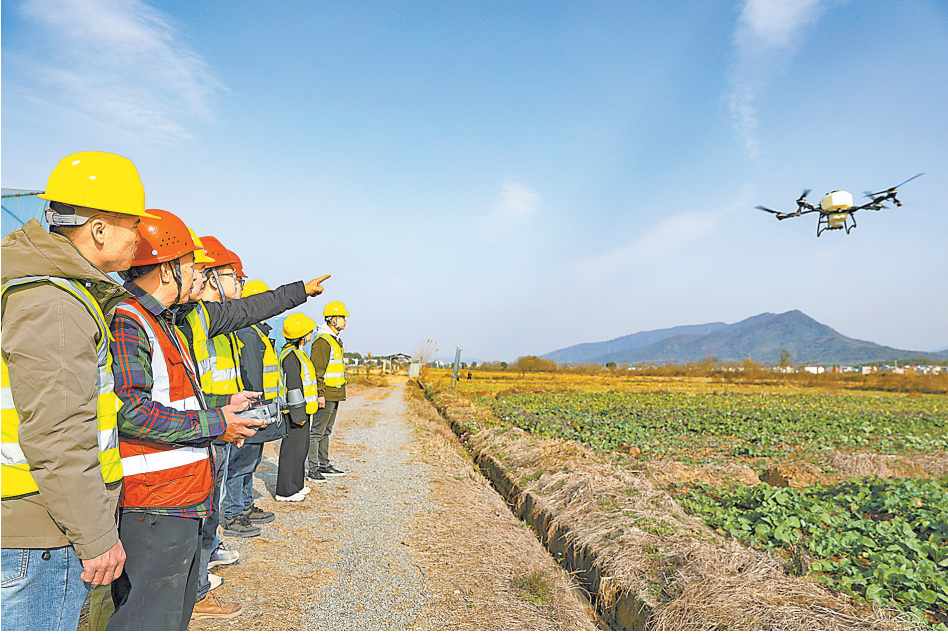
学员们在接受无人机实操培训。

2023年12月,刘武英瞄准这一商机,成立了农业无人机培训基地,目前已培育新农人600余名,其中残疾人无人机飞手18人,为当地智慧农业发展筑牢人才根基。 除开展培训外,该公司还从事农业无人机销售、租赁、维修等服务。此外,公司还开展土地托管服务,目前已在瑞昌、彭泽、湖口、武宁等地全程托管土地5000余亩,半托管土地6万余亩,带动600余户农户增收。