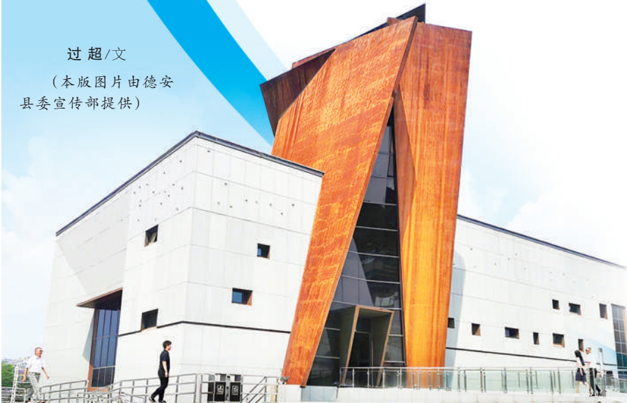
万家岭大捷纪念馆陈列馆