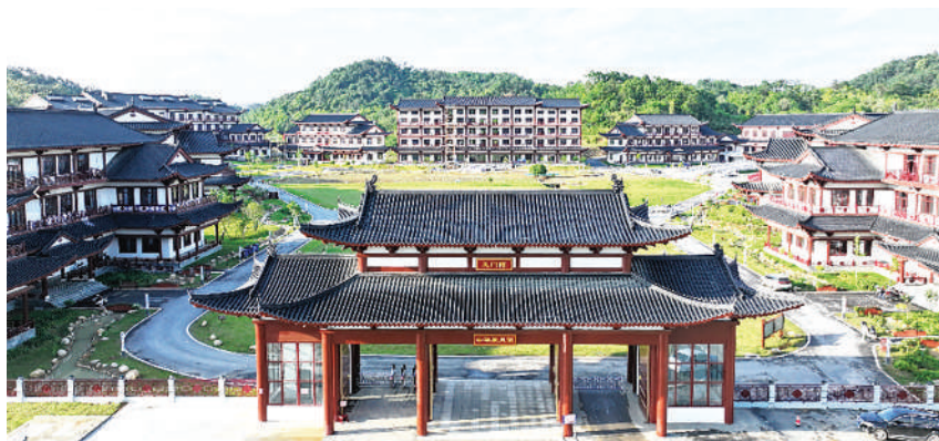
义门陈文化产业园

这片土地上，道德的光芒同样璀璨夺目。11名“中国好人”、15名“江西好人”、20名“九江好人”……这些来自群众