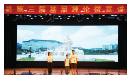
德安县第三届基层理论微宣讲大赛现场

这些将深刻思想转化为艺术语言的创新尝试，用小舞台讲述大道理，让党的创新理论在掌声与笑声中“飞入寻常百姓家”，在丰富群众精神文化生活的同时，凝聚起团结奋进的强大力量。