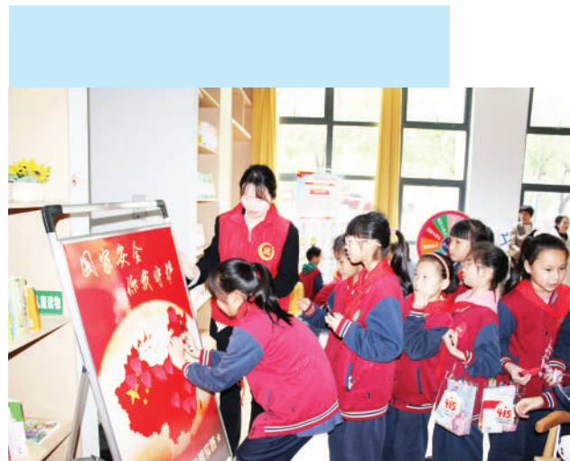
国家安全教育日文明实践活动

行走在今日的德安，处处可以感受到一种昂扬向上的力量。这种力量，源于理论入心后的思想统一，来自文明滋养中的道德提升，得益于文化传承带来的自信从容，也彰显于舆论广传所塑造的鲜明形象。这四股力量如四条奔涌的河流，在德安大地交汇融合，共同托举着一个经济发展有活力、精神文化有高度、形象传播有广度的新德安，稳步迈向更加美好的明天。