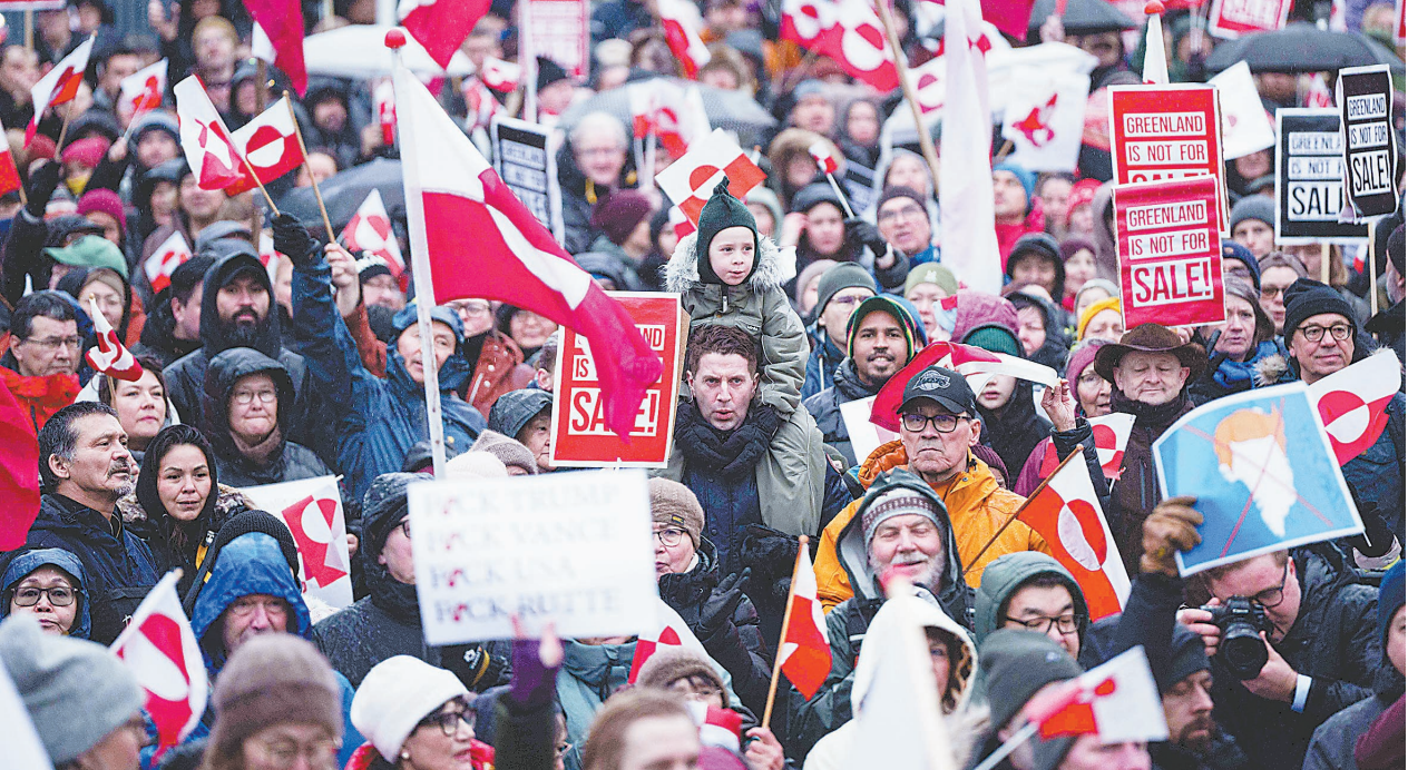
1月17日，在位于丹麦自治领地格陵兰岛首府努克，人们参加示威游行。当日，格陵兰岛努克举行示威游行，抗议美国企图“控制”或“购买”格陵兰岛。