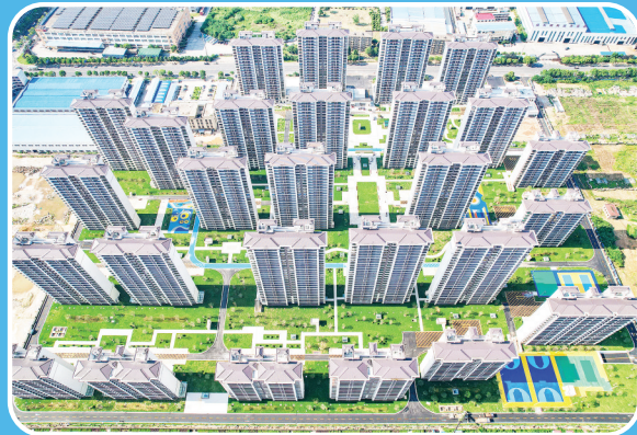
总建筑面积约38万平方米的安永人家四期保障房是九江市首个采用装配式钢管混凝土束组合结构的安置小区