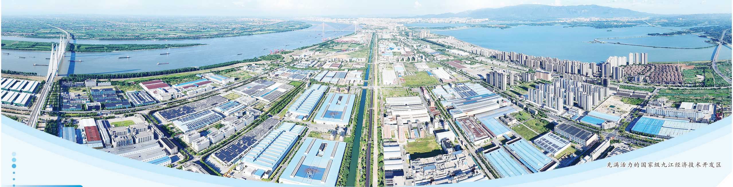
充满活力的国家级九江经济技术开发区