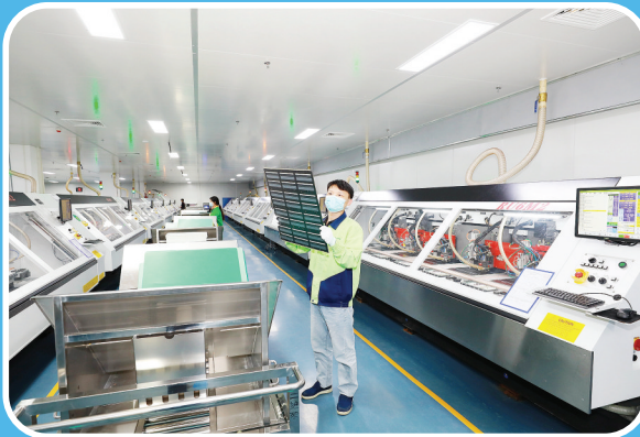
省级两化融合示范企业——江西爱升精密电路科技有限公司