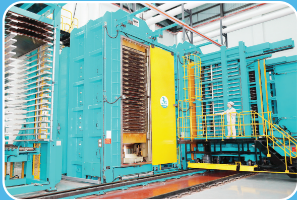
省级制造业单项冠军企业——江西生益科技有限公司