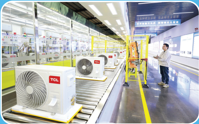
省级绿色工厂——TCL空调器(九江)有限公司