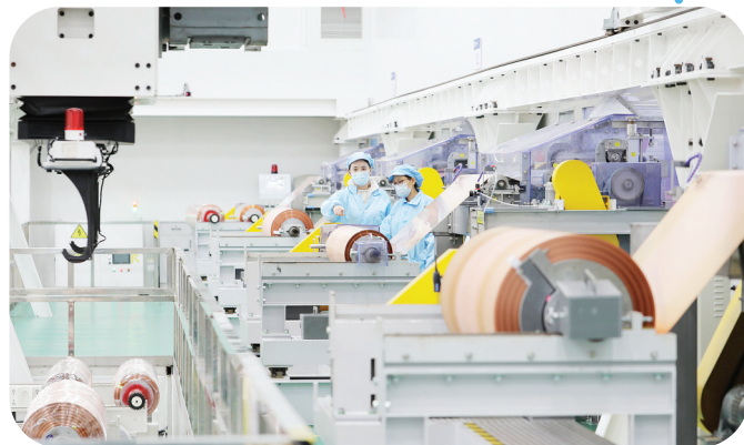
国家级专精特新“小巨人”——九江德福科技股份有限公司