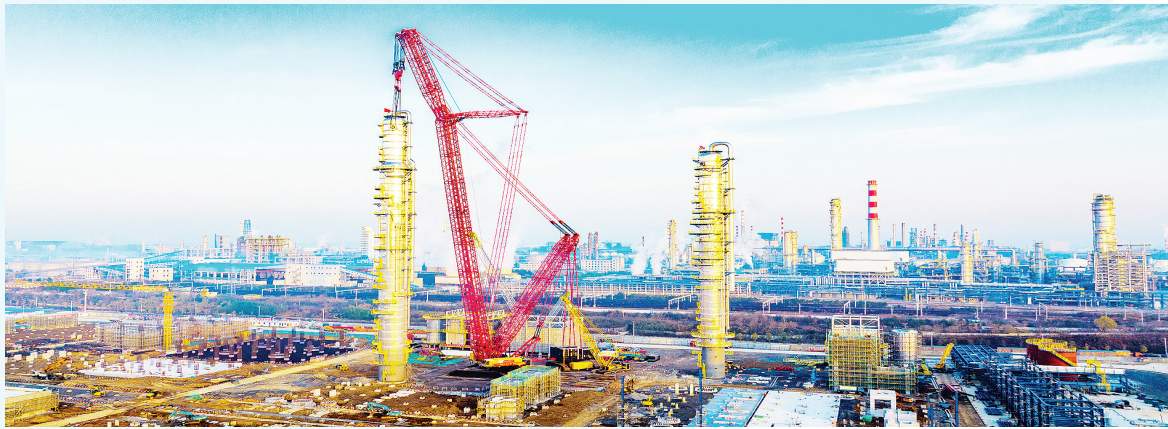
建设中的中国石油化工股份有限公司九江分公司年产150万吨芳烃及炼油配套项目