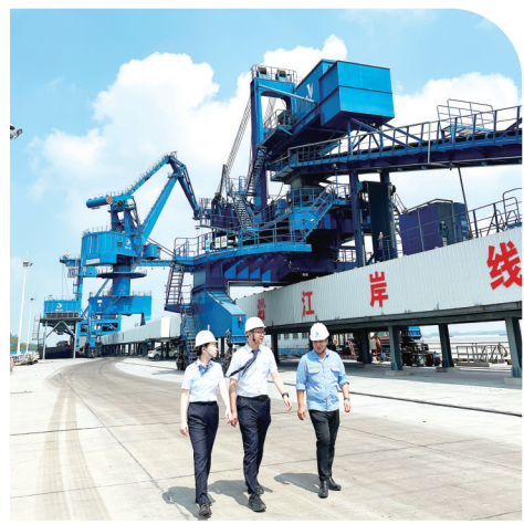
组建“港口升级专项服务团队”深入项目现场调研企业经营、定制授信方案

深挖红色资源，赓续精神血脉。分行依托江西丰厚的红色底蕴，每年组织党员干部赴井冈山、瑞金、于都等地开展沉浸式教学。通过专题党课、现场讲解、情景体验、与红军后代对话等形式，引导党员干部在重温峥嵘岁月中学接受精神洗礼，深刻感悟井冈山精神、苏区精神、长征精神的时代内涵，自觉将理想信念转化为服务实体经济、防控金融风险、深化改革创新