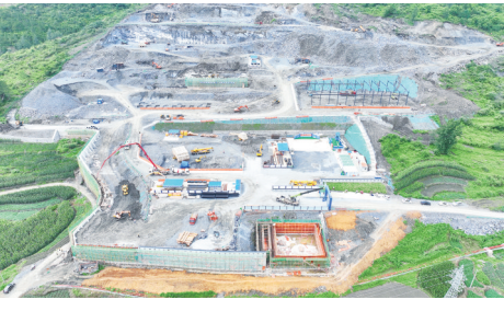
香炉山新选矿厂施工现场

绿色开采，生态修复并举。香炉山钨业投入巨资，建成全尾砂胶结充填系统，不仅有效治理了历史遗留的采空区安全隐患，还将选矿尾砂变废为宝，实现“产废不出坑、废石不外排”。企业获评国家级绿色矿山和国家级高新