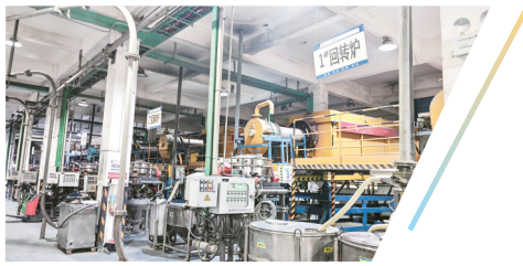
赣北钨业氧化钨生产场景

钨，被誉为“工业的牙齿”，是关乎国家战略安全和高端制造发展的关键矿产资源。修水县白钨资源优势明显，如何将资源优势转化为产业胜势、竞争优势？近年来，修水县深入贯彻落实省委省政府关于加快构建体现江西特色和优势的现代化产业体系的政策部署，紧密对接中国五矿集团“矿业报国、矿业强国”战略，以“打造百亿钨产业链”为目标，坚持规划引领、创新驱动、链式发展、绿色安全，推动钨产业从矿山采选向高端制造加速跃升，探索出一条资源型县域工业高质量发展的特色路径。