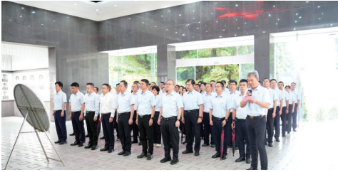
分行党委理论学习中心组(扩大)学习暨党建和政治理论学习培训班学员集体向革命先烈敬献花圈

赣江潮涌，奋楫者先。在中国式现代化江西实践的壮阔征程中，建行江西省分行始终胸怀“国之大者”，坚守金融工作的政治性、人民性，聚焦“走在前、勇争先、善作为”的目标要求，全力服务江西加快打造“三大高地”、实施“五大战略”，将金融“活水”精准注入革命老区高质量发展的脉络，以实际行动诠释国有大行的责任担当。