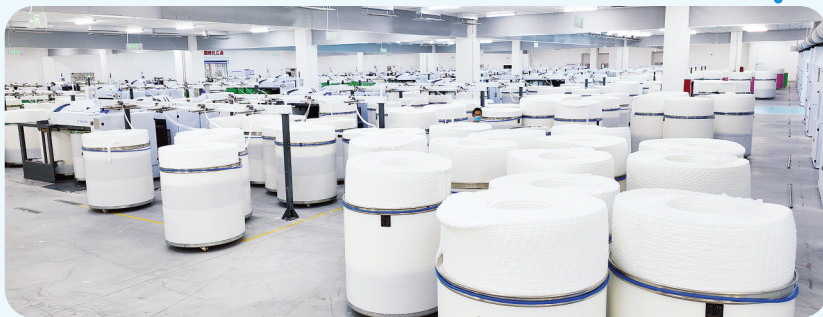
▼ 江西宝鑫纺织有限公司