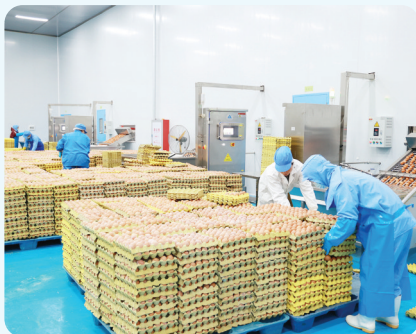
江西夏小美食品有限公司

乡村振兴全面提质。农业产业化“双百行动”深入推进，超亿元农业企业梯次培育。蛋鸡产业规模突破750万羽，年产值25亿元，成为全市乡村振兴标杆；“德安鸡蛋”“德安甲鱼”入选全国名特优新产品名录，农业品牌影响力持续扩大。农村人居环境整治成效显著，省级、市级“四融一”和美乡村先行村建设有序推进，和美乡村底色愈发亮丽。