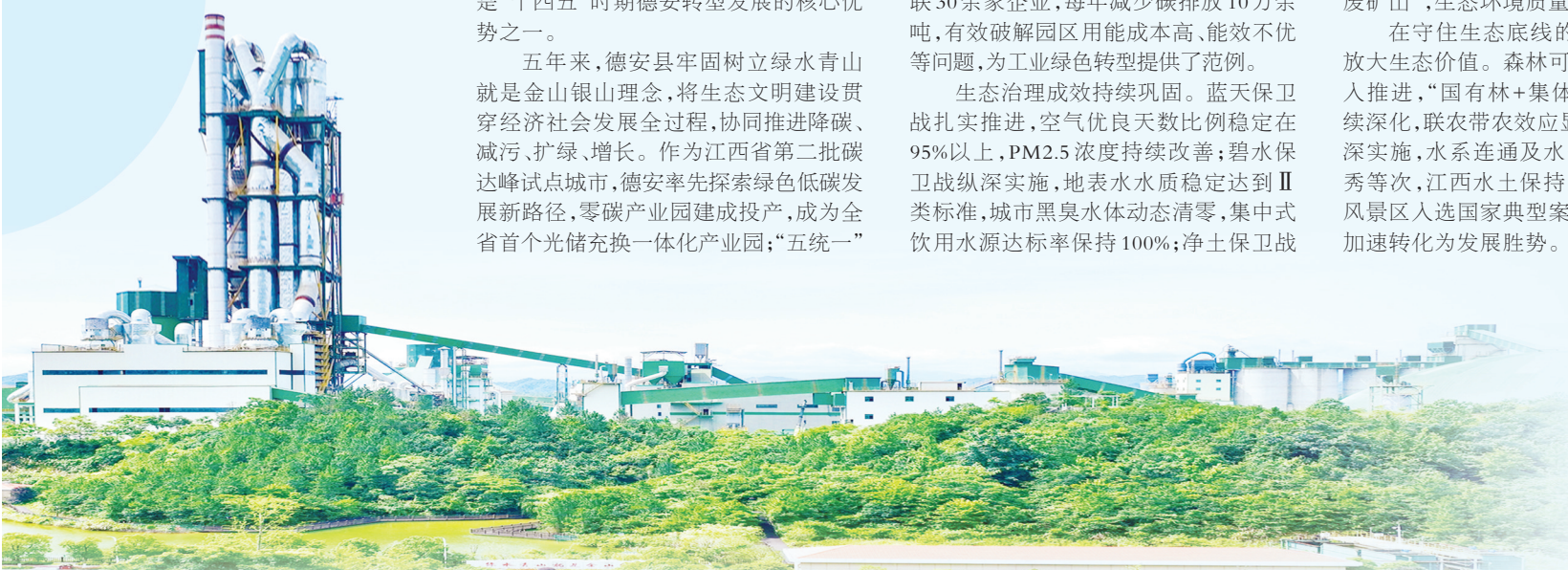
江西德安万年青水泥有限公司

在守住生态底线的同时，德安不断放大生态价值。森林可持续经营改革深入推进，“国有林+集体林”联营模式持续深化，联农带农效应显著；水利改革纵深实施，水系连通及水美乡村建设获优秀等次，江西水土保持生态科技园水利风景区入选国家典型案例。生态优势正加速转化为发展胜势。