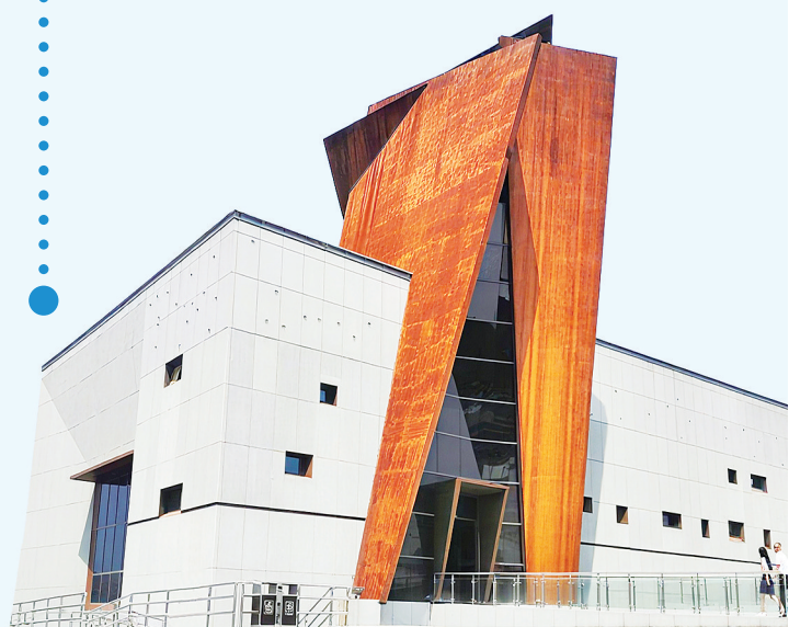
万家岭大捷纪念馆陈列馆

回望“十四五”，德安以实干破题、用奋斗作答，在高质量发展的道路上留下了坚实而深刻的印记。展望“十五五”，新征程的号角已经吹响。这座千年古县，必将以更加昂扬的姿态，在新的赶考之路上踔厉奋发、勇毅前行，奋力开创德安经济社会高质量发展新局面。