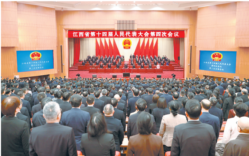
1月31日，省十四届人大四次会议圆满完成各项议程，在南昌胜利闭幕。