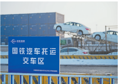
春运临近,越来越多的人选择给爱车买一张春运火车票。这是在新疆乌鲁木齐拍摄的中铁特货乌鲁木齐分公司三坪物流基地国铁汽车托运交车区。