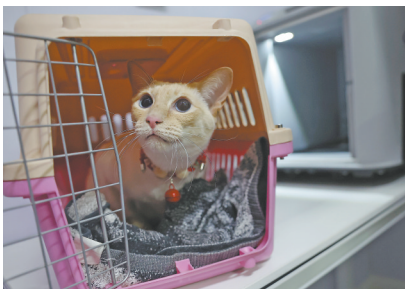
铁路部门自1月28日起再次扩大高铁宠物托运服务试点范围。2月1日,一只小猫在中铁快运兰州西站营业部宠物交接区准备进入高铁宠物运输专用箱。