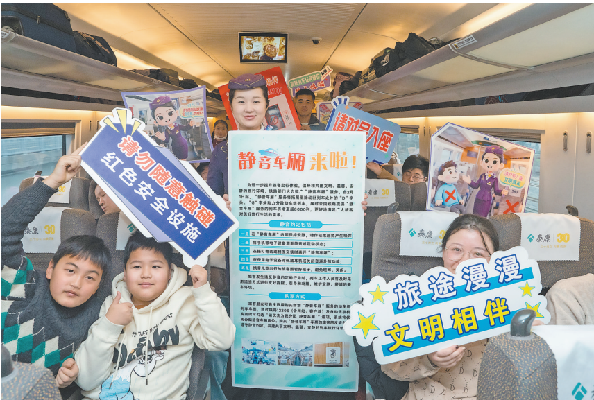
2月1日,中国铁路上海局集团有限公司合肥客运段在G54次列车上进行“静音车厢”宣介活动。

自2月1日起,高铁“静音车厢”服务将拓展至除动卧列车之外的“D”字头、“G”字头部分列车,全国铁路提供“静音车厢”服务的列车将超8000列。