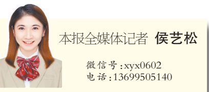
本报全媒体记者 侯艺松