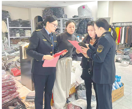
执法人员在给经营者讲解直播新规。