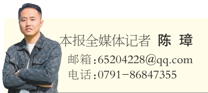
本报全媒体记者 陈璋