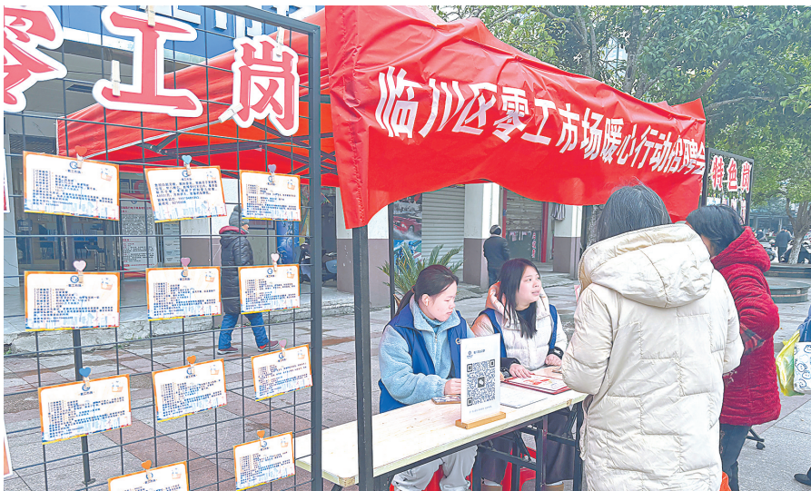
临川区零工市场门口,求职者正在咨询岗位。

零工虽小,关乎民生生计。为破解灵活就业者“找活难、技能弱、稳岗难”的困境,近年来,抚州市临川区精心打造零工市场,创新构建“岗位精准匹配+免费技能赋能+全周期跟踪服务”闭环模式,让每一名灵活就业者在家门口找到称心活、练就硬本领、稳住增收路,走出一条有温度、有力度、可持续的就业新路径。