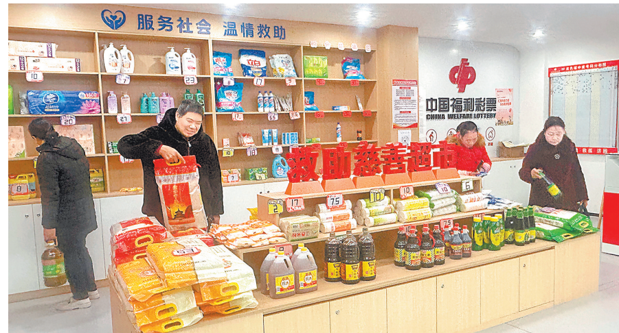
群众在救助慈善超市选购生活物品。

走进广场社区党群服务中心,救助慈善超市吸引着过往居民的目光。货架上,大米、食用油、面条等生活必需品码放整