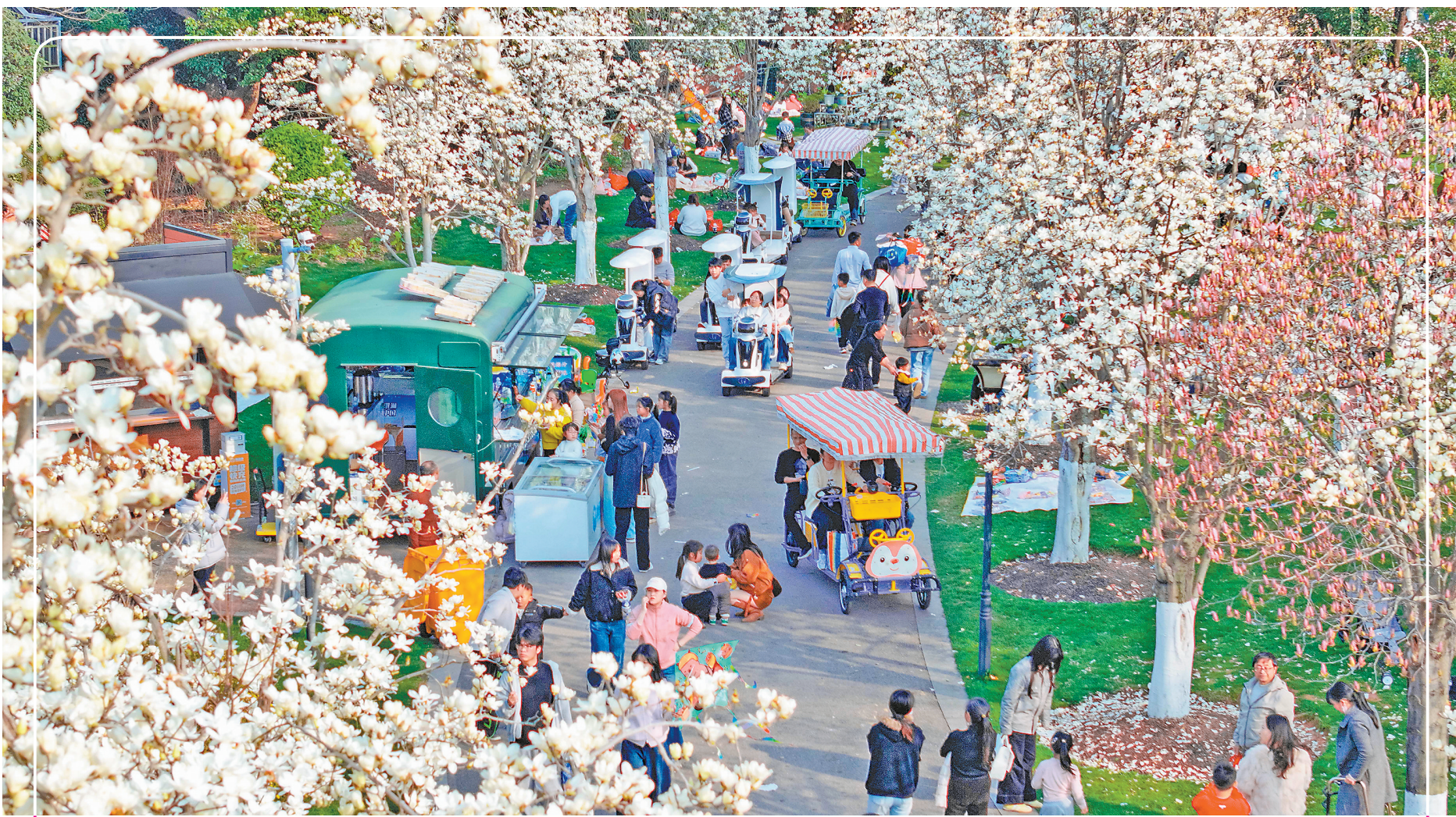
近年来，抚州市因地制宜建设现代城市公园，不断优化城市生态环境，着力打造“15分钟生态休闲圈”，为城市生活注入更多暖意与生机。图为3月15日，抚州市城区三翁花园内，玉兰竞相绽放，处处洋溢着春日气息，吸引不少市民前来赏花游玩。