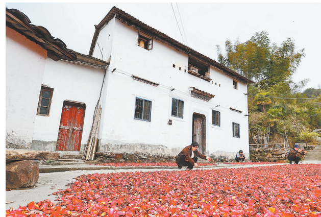
3月17日，德兴市新岗山镇村十八亩段，村民在房前屋后晾晒红花油茶花。德兴红花油茶是国家农产品地理标志产品，红花油茶林面积居全国第一，产品涵盖食用油、护肤品等，畅销全国。

政策兜底，公益性岗位守住民生底线。2025年以来，萍乡市公益性岗位已帮助6035名就业困难人员实现家门口就业，通过设公益岗、织保障网，托底式暖心服务让困难群众就业“有依靠、有奔头”。莲花县患病村民冯志平一家生活困难，妻子体弱，育有两个女儿。乡村就业协管员走访了解情况后，迅速为其制定帮扶方案，冯志平成功应聘公益性岗位图书管理员，有了稳定收入，既缓解了生活上的燃眉之急，也让他重新找回了生活的底气。