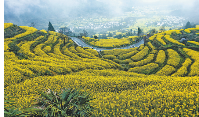
婺源江岭油菜花。

春到婺源，13万亩油菜花绽放，漫山遍野的金黄将白墙黛瓦的徽州古村包裹，小桥流水间飘着烟火气，仿佛一幅幅诗意的画卷，吸引着天南海北的游客前来踏青。