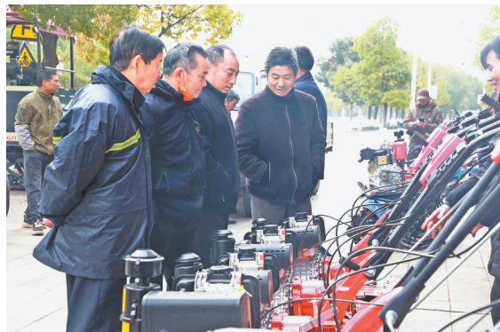
▲石城县各大农机市场积极强化服务保障，备足各类农机具，确保货源充足，供应顺畅，助力春耕生产。图为农户在选购农机。