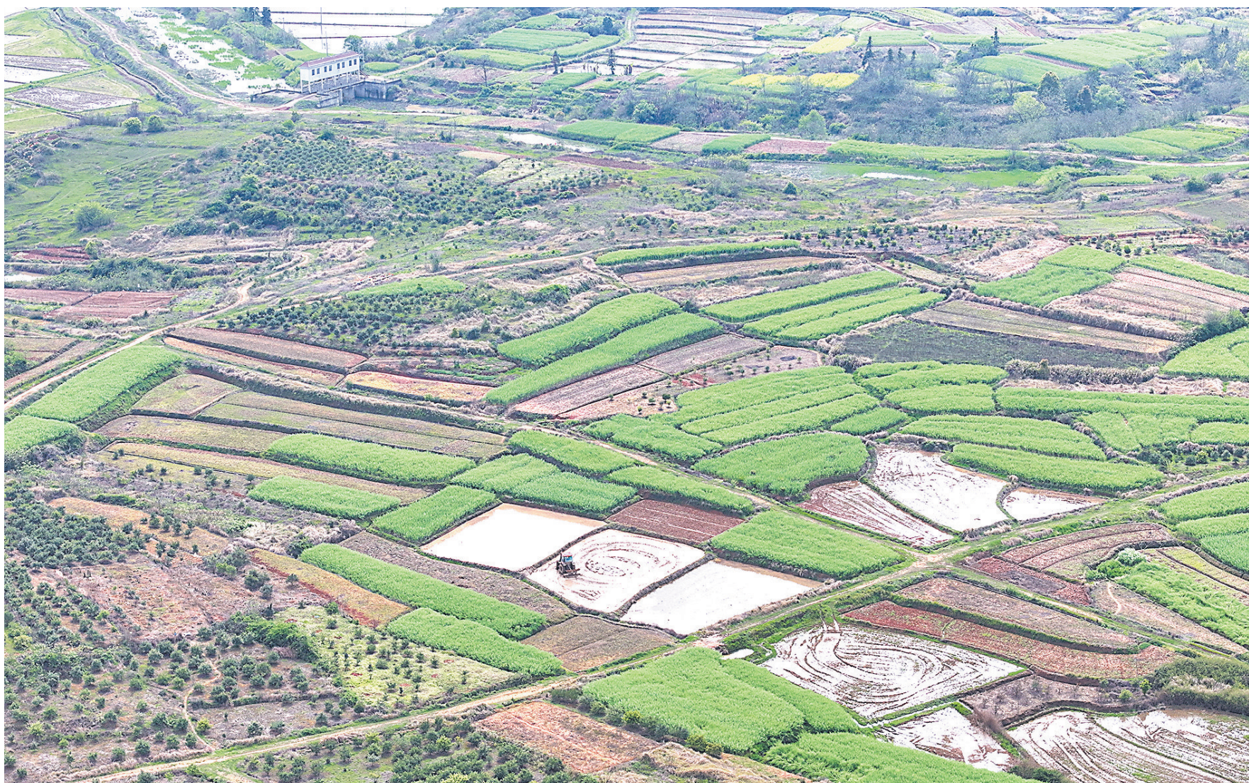
4月4日，丰城市隍城镇田间地头机械轰鸣，农户驾驶农机平整农田，为下一步春耕播种做准备。

如今，安远县已引进“周末工程师”120余名，他们不仅破解了80余项产业技术、农业种植及医疗诊疗难题，还带出了200余名本土技术骨干，“周末智慧”转化为安远高质量发展的强劲动能，为乡村振兴和县域经济发展注入源源不断的智力“活水”。