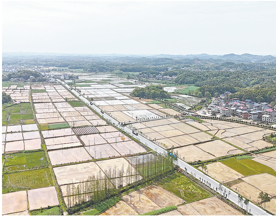
4月5日，万年县汪家乡新建村连片水田蓄满春水，村民抢抓农时翻耕整田，一派繁忙景象。

今年，乐平市推广的工厂化育秧技术使秧苗质量大幅提升，为机械化栽插打下了坚实基础。目前，乐平24万亩早稻栽插已全面启动，全市早稻机械化栽插率预计超90%，比去年提高5个百分点。