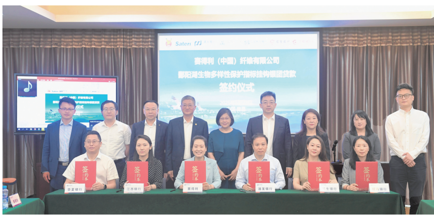
浦发银行南昌分行投放全国制造业及外资企业“双首单”生物多样性保护指标挂钩银团贷款

创新是第一动力，数智化是服务实体的重要引擎。2025年，该行以浦发银行总行数智化战