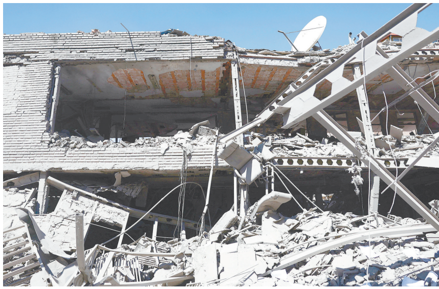
这是4月7日在伊朗德黑兰的谢里夫理工大学拍摄的美以空袭后的废墟。