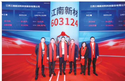
浦发银行南昌分行参与企业上市敲钟仪式

金融为民，初心如磐；“浦”惠赣鄱，温情相伴。该行坚持以人民为中心的发展思想，将金融服务的触角延伸至百姓日常生活，以有温度的金融服务，守护百姓幸福生活。通过深化“井冈红”品牌建设，鼓励基层探索融合新路，打造党建工作特色亮点。该行将党建文化与浦发银行企业文化深度融合，凝聚干事创业的合力。该行围绕“项目党建”“圈链党建”，扎实开展金融服务活动、联合主题党日、党课学习、群团志愿服务活动，促进党建与中心工作深度融合，以高质量党建引领保障高质量发展。深耕养老金融，依托总行“浦颐金生”养老特色品牌，实现所有营业网点养老服务专属窗口、绿色