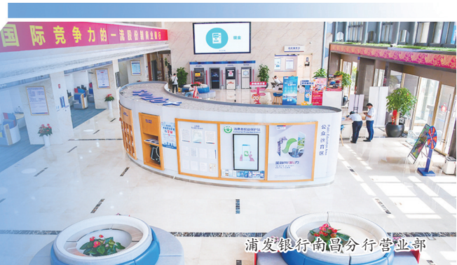
浦发银行南昌分行营业部

赣江潮涌，奔涌二十一载奋进力量；红土沃野，滋养金融为民不变初心。二十一年栉风沐雨，二十一年步履铿锵，从初入洪城到深耕全省，从单点布局到织密网络，浦发银行南昌分行已在南昌、九江、赣州、上饶、宜春、吉安、抚州7个设区市设立41家营业机构，累计为江西提供各类融资超9000亿元，服务公司客户3.8万余户、个人客户超260万户，多次获评江西省“金融服务贡献奖”“金融产品创新贡献奖”“直接融资贡献奖”“全省绿色金融先进单位”等称号。2025年，该行荣获全省“产业金融发展贡献奖”。