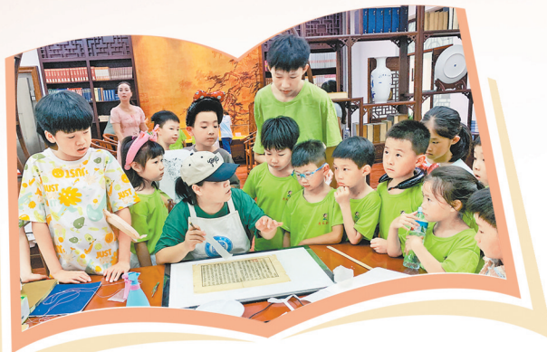
乐平市图书馆举行中华传统晒书活动。

书香氤氲处，自有桃花源。在千年瓷都景德镇，全民阅读早已融入人们的生活日常——晨曦微露，校园里孩子们清亮的诵读声，如清泉般流淌，为崭新的一天铺就知识的序章；午后静谧，图书馆内书页悄然翻起，墨香在读者指尖流转不息，沁人心脾；暮色四合，有声读物余韵悠长，伴着人们归家的步履，将故事洒满一路。