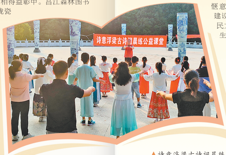
▲诗意浮梁古诗词晨练公益课堂每周六定期开讲。

从图书馆、书店里陶瓷文化的可观可感，到文化遗存中穿越时空的沉浸式体验，再到优质数字阅读内容的供给，折射出景德镇在拓展城市阅读广度与深度方面的生动实践。近年来，景德镇坚持创新思维，以读者为中心重塑阅读场景，通过优化空间布局、升级服务方式，让读者既能在瓷韵书香里触摸城市的文化根脉，又能在指尖轻触间享受数字化带来的便捷，城市阅读新格局正在传统与现代的交融中加速形成。