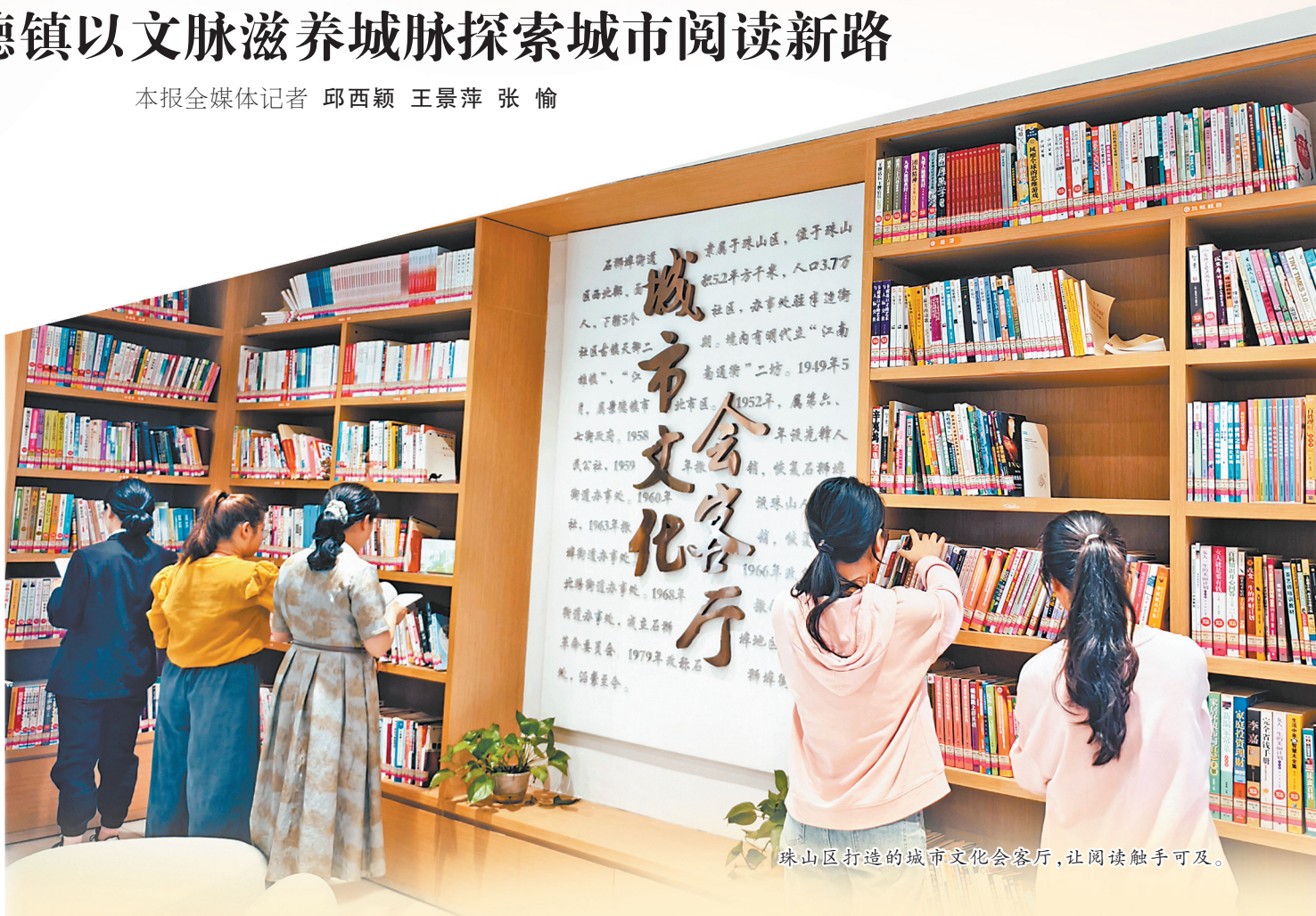
珠山区打造的城市文化会客厅，让阅读触手可及。

一城书香一城梦，满目风华满目春。近年来，围绕景德镇国家陶瓷文化传承创新试验区建设，景德镇以系统性思维打造书香城市，奋力探索“内涵建设、多元创新、文明实践+”三位一体的城市阅读发展新路径，推动全民阅读从“有形覆盖”走向“有效深耕”，不断以文脉滋养城脉，以书香涵养风尚，为城市高质量发展注入源源不断的文化新动能。