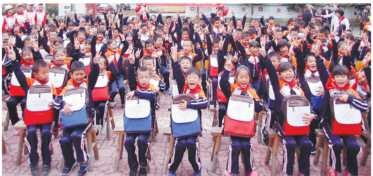
兴国县方太乡小学学生收到“名著小书包”时的开心场景。