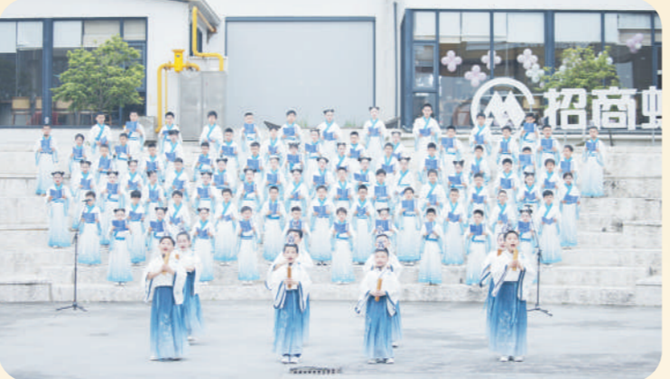
东湖区开展《此心光明·少年行》户外大型诵读活动

春和景明，书香四溢。4月13日，“千年文脉 阅见东湖”南昌市东湖区全民阅读系列活动在招商蛇口东湖意库正式启动，一场场可观、可听、可感、可参与的沉浸式阅读体验，让东湖千年文脉在新时代焕发出全新生命力。