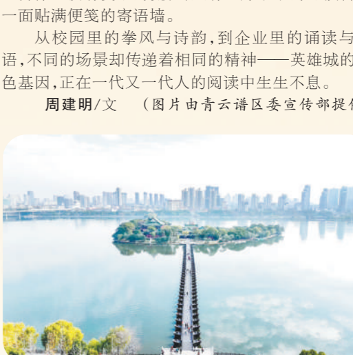
位于青云谱区的豫章书院泽桥