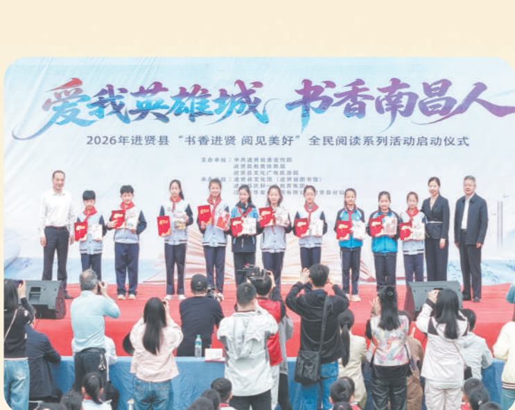
进贤县开展世界读书日相关活动

春风送暖，翰墨飘香。4月15日，“爱我英雄城 书香南昌人”2026年进贤县“书香进贤 阅见美好”全民阅读系列活动在民和第一小学教育集团正式启动。一场集成果展示、倡议宣讲、互动体验于一体的书香盛宴，全面拉开全县全民阅读活动序幕，让浓郁书香浸润进贤城乡大地。