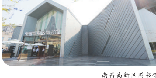
南昌高新区图书馆