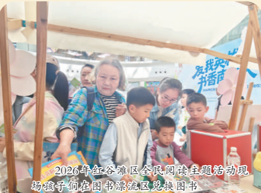
2026年红谷滩区全民阅读系列活动启动仪式在孺子书房南昌红谷滩区总馆举行