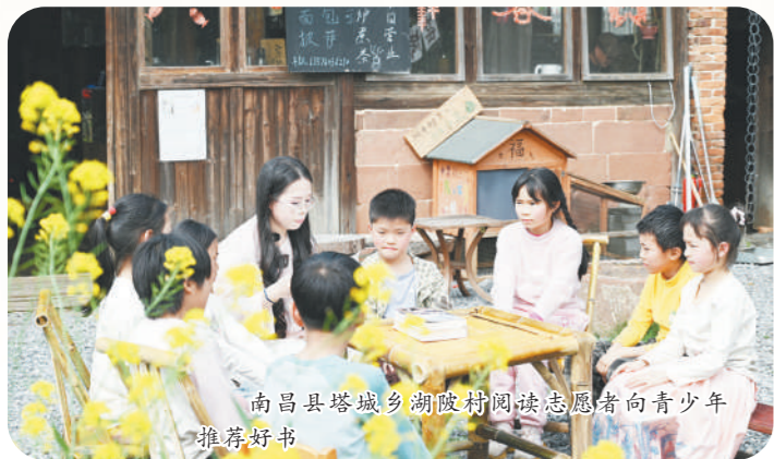
南昌县塔城乡湖陂村阅读惠童向青少年推荐好书