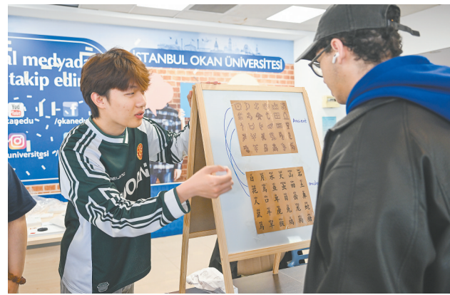
4月20日，在土耳其伊斯坦布尔奥坎大学，学生参与一项认识中文的游戏。

当日是第七个“国际中文日”，土耳其伊斯坦布尔奥坎大学孔子学院举办丰富多彩的“国际中文日”活动，吸引不少大学生参与其中。