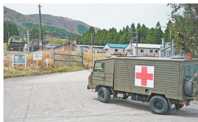
4月21日，一辆军用救护车抵达日本大分县陆上自卫队“日出生台演习场”。

中国驻老挝大使方虹致辞表示，中老联网工程顺利投产，构建起电力双向互济的“绿色能源大动脉”。中方愿以此类项目为示范，进一步深化中老新能源领域务实合作，助力老挝实现能源转型，推动中老友好合作向更广领域、更深层次、更高水平迈进，为构建更为紧密的中老命运共同体注入持久动力。