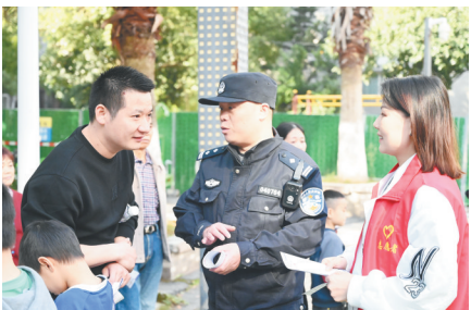
社区民警与网格员向居民普及反诈、消防安全等相关知识

横龙社区的警网融合服务站，配备监控设备、应急物资和便民工具，让群众在家门口就能报案、咨询、求助。警网融合不仅建立了每日信息共享、每周联合走访机制，还组建了流动调解室，联合律师、社