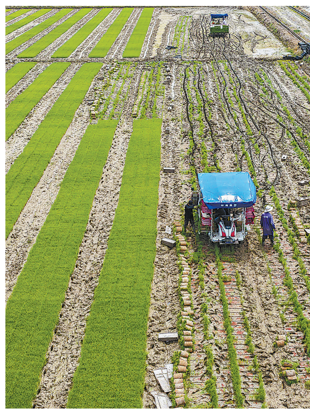
4月20日，庐山市沙湖山鄱阳湖湿地生态保护区高标准农田里，农民忙着栽插早稻秧苗。当地充分利用好高标准农田建设成果，组织开展集约化育秧、机械化插秧、无人机施肥等农事作业。