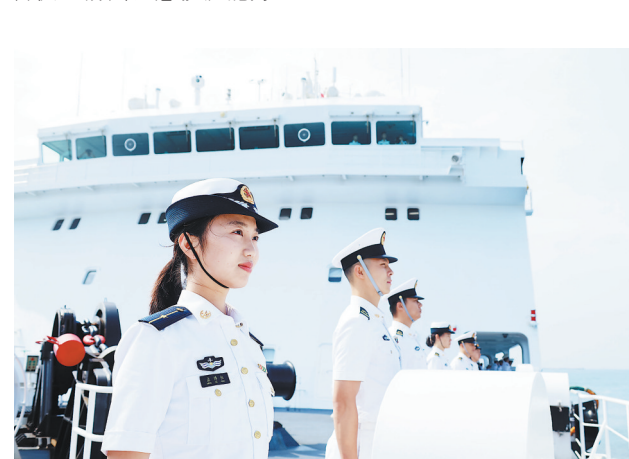
4月26日，中国海军“丝路方舟”号医院船圆满完成“和谐使命-2025”任务，靠泊海南三亚某军港，医院船官兵分区列队。

作为中国自主建造的第二艘万吨级制式远洋医院船，“丝路方舟”号医院船搭载14个临床科室、7个辅助科室、8间现代化手术室，可开展60余种手术，配备完备舰载救护直升机，具备快速前出应急救援能力。